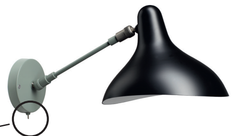
BS5 SW GR-BL

Black mat | Satin nickel Noir mat | Nickel satin