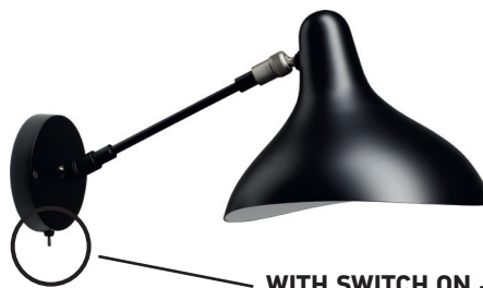
BS5 SW BL

Green mat | Black satin | Satin nickel Vert mat | Noir mat | Nickel satin